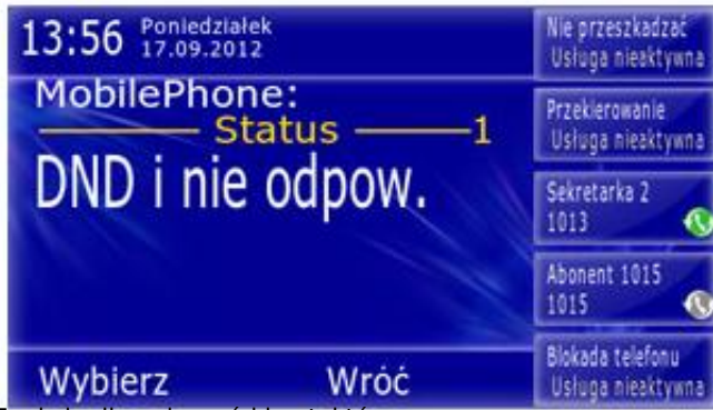
Funkcje dla połączeń i kontaktów